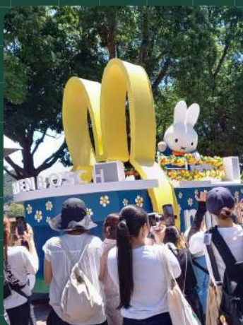
ミッフィーとメラニーに 会えるイベントもあります！