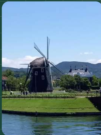
まるでオランダ！ 風車のある風景