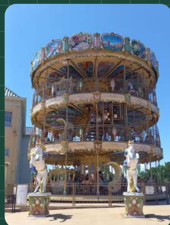
日本ではここだけ！ 三階建メリーゴーランド