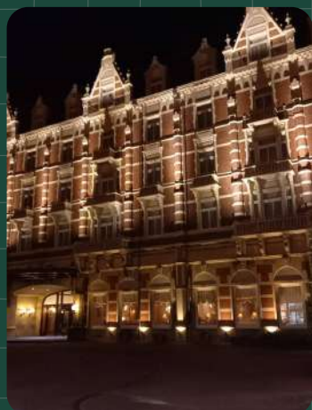
夜のハウステンボス ライトアップが幻想的