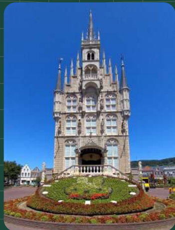
壮麗な宮殿と 可愛いミッフィーの花壇