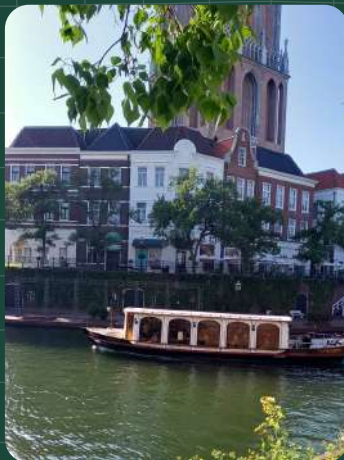
ヨーロッパの街並みを巡る 運河クルーズ