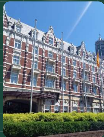
ハウステンボス内の 美しい外観のホテル