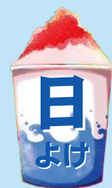
目にも涼しい グリーンカーテン