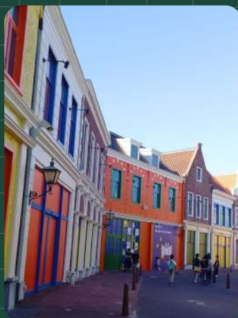
まるで絵本のように カラフルな街並み